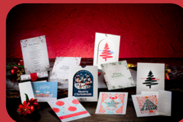
Biglietti di auguri